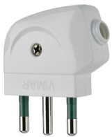
00212.B - Stecker 2P+E 16A S17 90° weiß