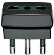
00300 - Adapter S17 + P17/11 schwarz