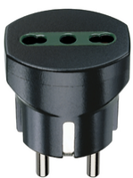
00301 - Adapter deu./fran.+P17/11 schwarz