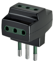
00320 - Vielfachadapter S11+3P11 schwarz