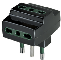
00321 - Vielfachadapter S17+3P17/11 schwarz