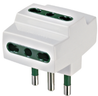
00321.B - Vielfachadapter S17+3P17/11 weiß