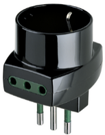
00322 - Vielfachadapter S11+2P11+P30 schwarz