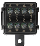
03997 - Rollläden-Modul Quid