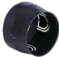
V71001.AU - Unterputzdose ø60mm schwarz