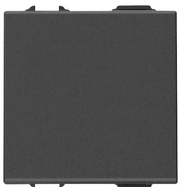
09001.2.CM - Schalter 1P 16AX 2M carbon matt