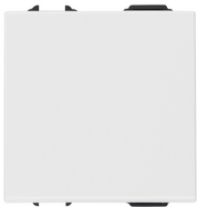
09008.2 - Taster 1P NO 10A 2M weiß