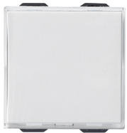
09050 - Taster m/Schild 1P NO 10A 250V weiß