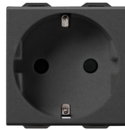
09208.CM - SICURY- Steckdose 2P+E 16A deutsch carbon