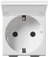
09208.C - SICURY- Steckd.2P+E 16A DE+Abdeck.weiß