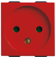
09240.R - SICURY-Steckdose 2P+E16A israelisch rot