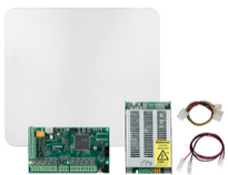
OK03800 - By-alarm Plus Set 25-Bereich