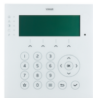
03817 - By-alarm Plus Display-Tastatur