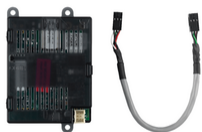
03812 - By-alarm Plus Alarmanlage-Gateway