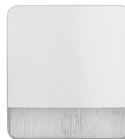
03827 - By-alarm Plus außen-Alarmsirene