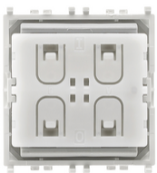
03906 - HF-Steuergerät Zigbee Friends of Hue