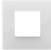
19642.B66 - Abdeckrahmen Classic 2M Reflex eis TL