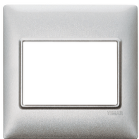
14648.27 - Abdeckrahmen 3M BS Techno Silver