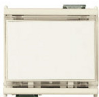
08420 - Taster m/Schild 1P NO 10A 12-24V