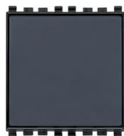
20050 - Taster m/Schild 1P NO 10A grau