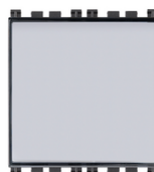
19050 - Taster m/Schild 1P NO 10A grau