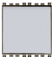
19050.M - Taster m/Schild 1P NO 10A Metal