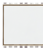
20050.B - Taster m/Schild 1P NO 10A weiß