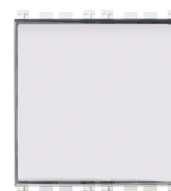
19050.B - Taster m/Schild 1P NO 10A weiß