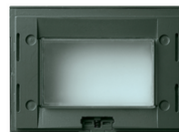
16813.Q - Rahmen IP55 3M grau