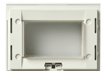
16813.Q.B - Rahmen IP55 3M weiß