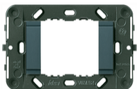
16722.L - Rahmen 2M glatt f/3M-Dosen grau