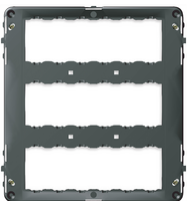
16719 - Rahmen 18M +Schrauben