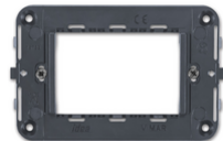
16723 - Rahmen 3M Arké Idea+Schrauben grau