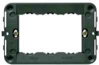
16713 - Rahmen 3M +Schrauben