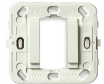
17086.B - Rahmen glatt 1M o/Schr. ø60/56x56mm weiß