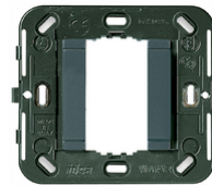
17086 - Rahmen glatt 1M o/Schr. ø60/56x56mm grau