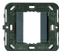
17086 - Rahmen glatt 1M o/Schr. ø60/56x56mm grau