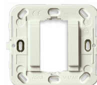
17086.B - Rahmen glatt 1M o/Schr. ø60/56x56mm weiß