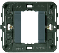
17080 - Rahmen glatt 1M +Krallen grau