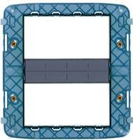
19618 - Rahmen 8M mit Schrauben