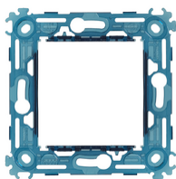
19603 - Rahmen 2M ohne Schrauben Abst71