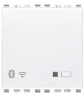
20597.B - IoT-Verbindung-gateway 2M weiß