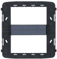
21618 - Rahmen 8M mit Schrauben