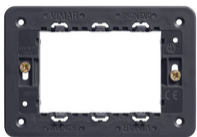
21613 - Rahmen 3M +Schrauben