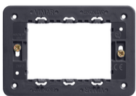
21613 - Rahmen 3M +Schrauben