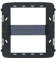
21618 - Rahmen 8M mit Schrauben