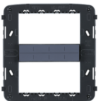
21618 - Rahmen 8M mit Schrauben