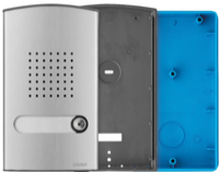
40141 - Audio-Klingeltableau 1-Familie