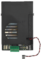
40131 - Audio-Elektronikeinheit 2F+