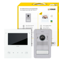
K40515G.01 - Set Video 1/2- Fam.Tab5S Up Wi-Fi+41005