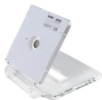
40595 - Tischgehäuse Tab 5 Up