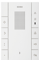
40547 - Haustelefon Voxie 2F+ 7-Taster weiß