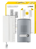
K40542.E - Kit citofonico 2F+ monof. 40542+40141