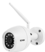
46237.040A - Kam. Bullet Wi-Fi Full-HD 1080p 4mm