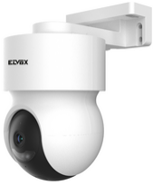
46241.030B - Außen-Kam.PT Wi-Fi 1080p 3mm