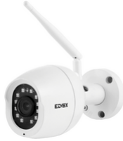
46237.040A - Kam. Bullet Wi-Fi Full-HD 1080p 4mm