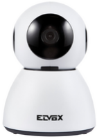
46239.040A - Kam. PT Wi-Fi Full-HD 1080p 4mm