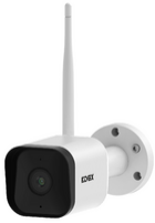
46242.036C - Zusatz-Kamera für Set 46KIT.036C