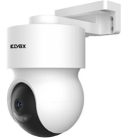
46241.030B - Außen-Kam.PT Wi-Fi 1080p 3mm