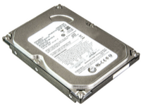
46925.030 - HDD professionell SATA 3,5in 3TB f/DVR