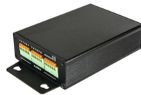
46936.001 - Alarm- Erweiterung USB