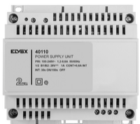
40110 - Netgerät 2F+ 100- 240V 1-Ausgang 1,6A