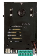
13F2.1 - Einheit A/V Due Fili Plus