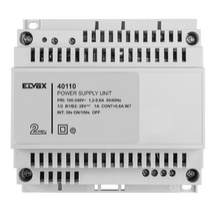
40110 - Netzgerät 2F+ 100- 240V 1-Ausgang 1,6A