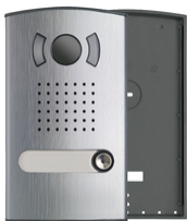
40151 - Audio/Video Farb- Klingeltableau 1-Fam.