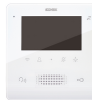
7558 - Videohaustelefon Tab Free 4,3 2F+ weiß