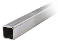
EBX8 - Antriebsrohr Kipptor KLYS9CD MASTER 2m