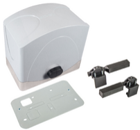
ESM2 - Antrieb ACTO 600D Schiebetore 24V 600kg