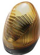
ELA5 - Blinkleuchte LED 12/24Vdc