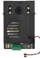
40135 - Audio7Video Einheit 2F+