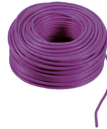
732I.C.100 - 2F+ Kabel 2x1 LSZH Cca 100m blaurot