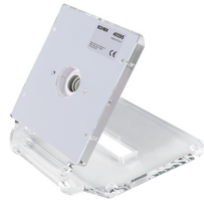
40595 - Tischgehäuse Tab 5 Up