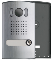
40151 - Audio/Video Farb- Klingeltableau 1-Fam.