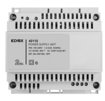
40110 - Netgerät 2F+ 100- 240V 1-Ausgang 1,6A