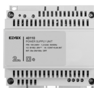
40110 - Netgerät 2F+ 100- 240V 1-Ausgang 1,6A