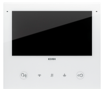
40517 - Videohaustelefon 2F+ Wi-Fi Tab7SUp weiß