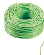
732I.E.500 - 2F+ LSZH-Kabel 2x1 Außenverleg. Eca 500m