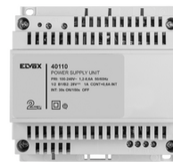
40110 - Netgerät 2F+ 100- 240V 1-Ausgang 1,6A