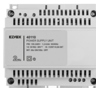
40110 - Netgerät 2F+ 100- 240V 1-Ausgang 1,6A