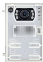
41005 - A/V-Einheit weitwink.teleloop 2F+