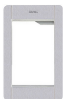
41131.01 - Rahmen+Abdeckrahmen 1M Pixel grau