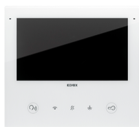
40517 - Videohaustelefon 2F+ Wi-Fi Tab7SUp weiß