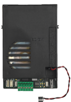
40131 - Audio-Elektronikeinheit 2F+